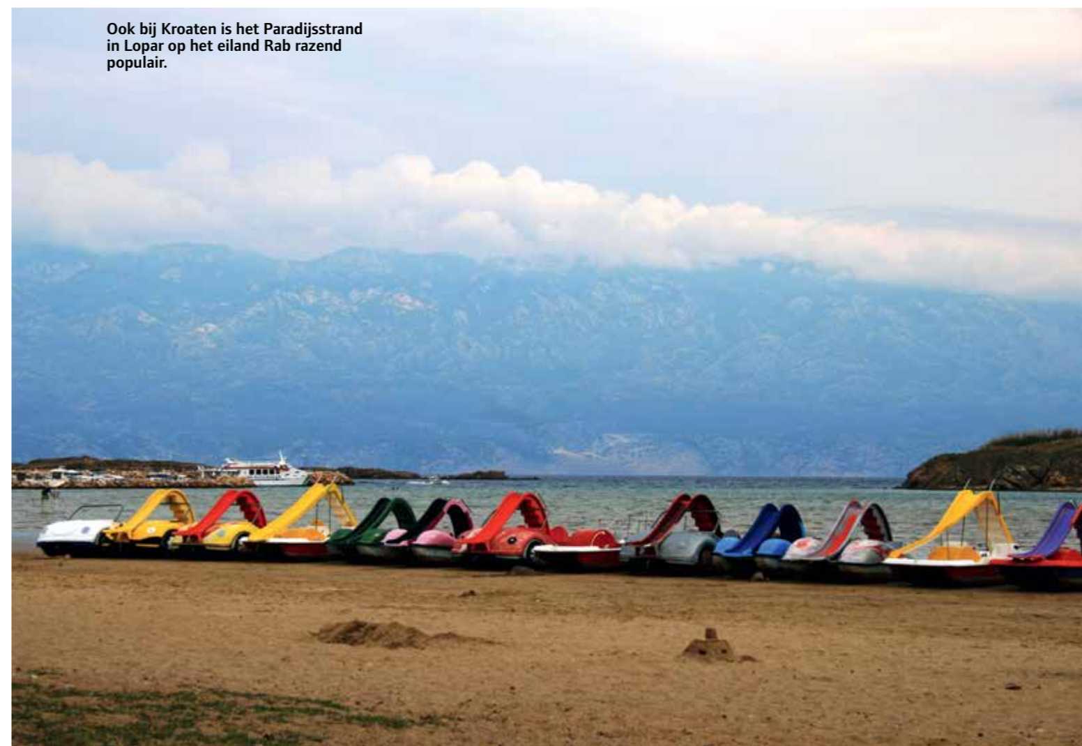
Ook bij Kroaten is het Paradijsstrand in Lopar op het eiland Rab razend populair.