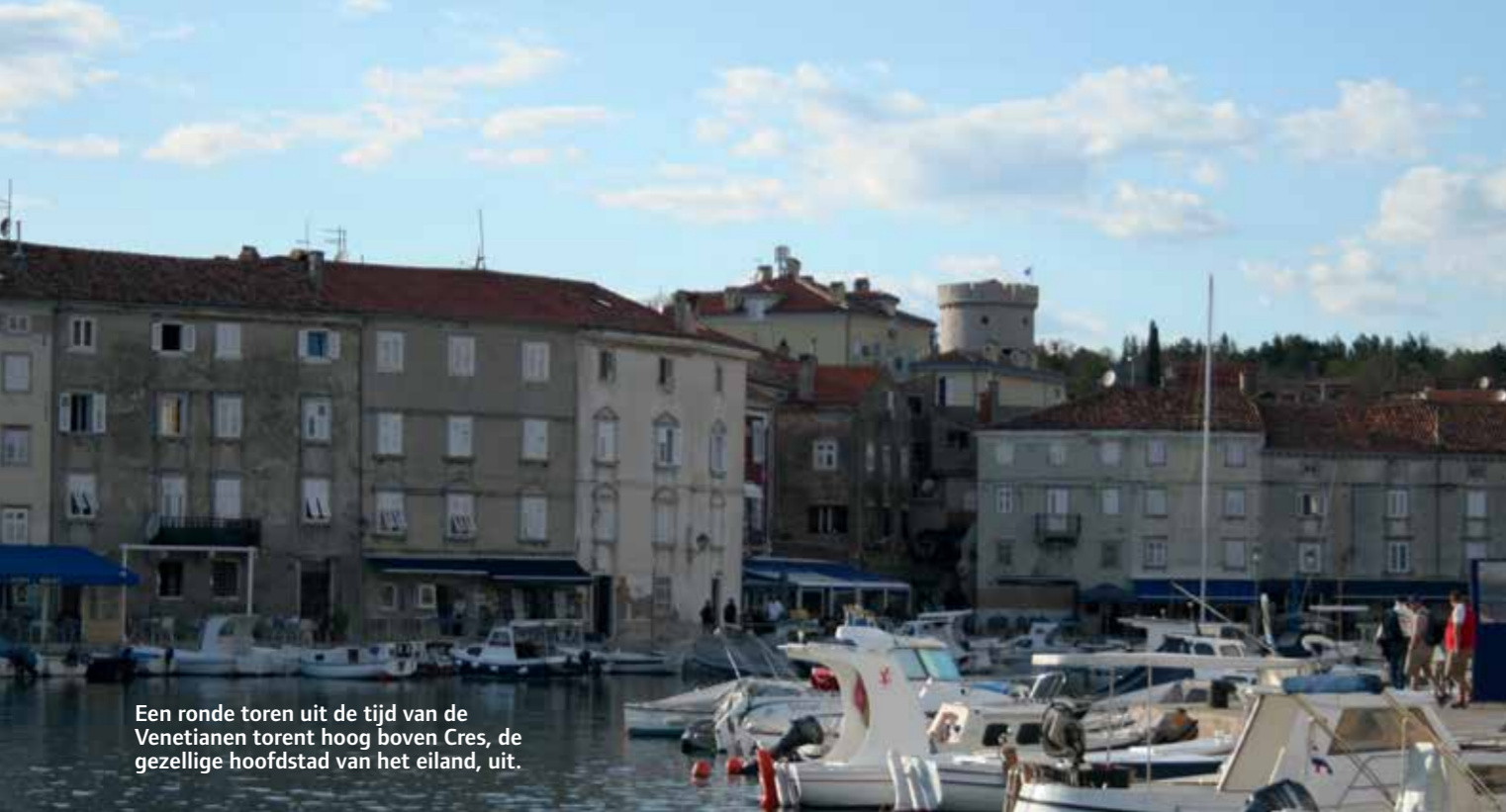
Een ronde toren uit de tijd van de Venetianen torent hoog boven Cres, de gezellige hoofdstad van het eiland, uit.