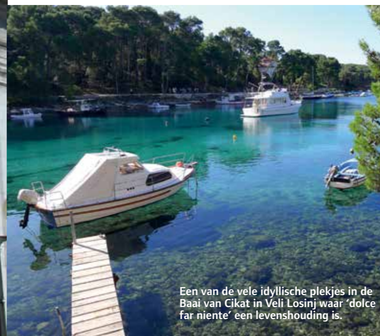
Een van de vele idyllische plekjes in de Baai van Cikat in Veli Losinj waar 'dolce far niente' een levenshouding is.