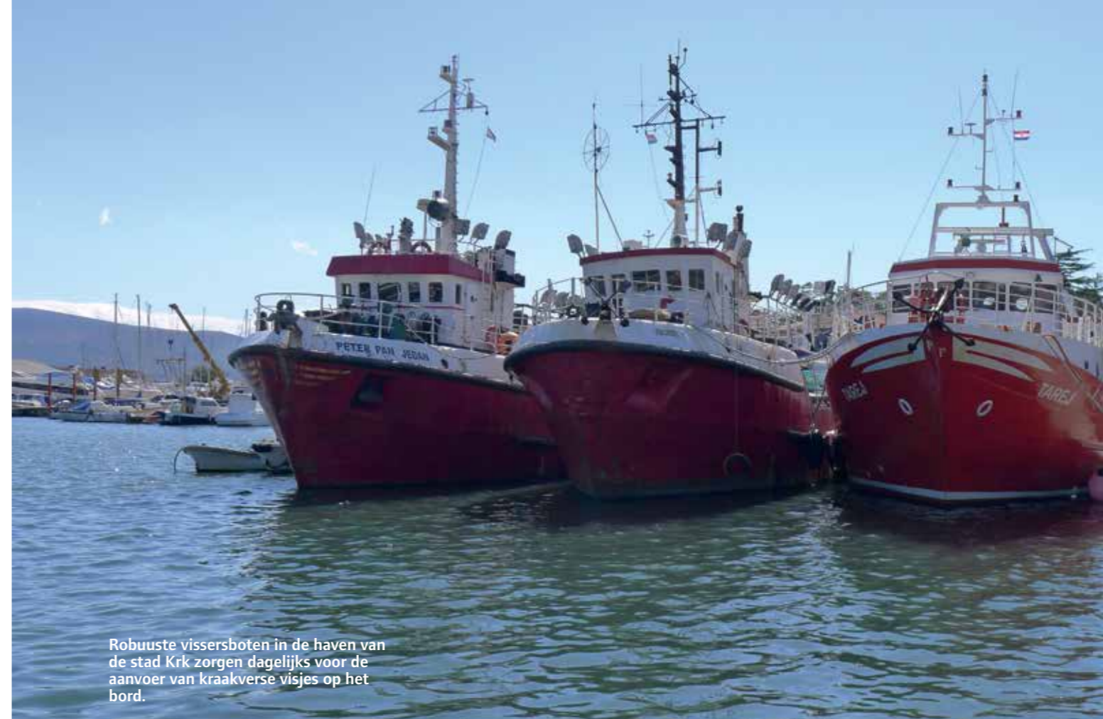
Robuuste vissersboten in de haven van de stad Krk zorgen dagelijks voor de aanvoer van kraakverse visjes op het bord.

Op het eerste gezicht lijkt havenstad Rijeka een echte heksenketel. Het vraagt een zekere stressbestendigheid om op de overvolle parkeerterreinen aan de haven nog een plekje te vinden. Maar als ik even later met een plaatselijke gids door de stad wandel, valt die drukte best mee. Het gaat er relaxed aan toe en op de vele terrassen op de Korzo, de brede winkelstraat in het hart van de stad, zit veel jong en schoon volk. De hoge negentiende-eeuwse gebouwen met mooie façades, de gezellige pleinen met fonteinen en sculpturen, het theatergebouw, de achthoekige barokke Sint-Vituskerk, de middeleeuwse stadspoort en toren met groot uurwerk en een Romeinse poort verwijzen naar een rijk verleden. In de tijd van de Habsburgers, vooral dan de periode van Maria Theresia, werd Rijeka dankzij