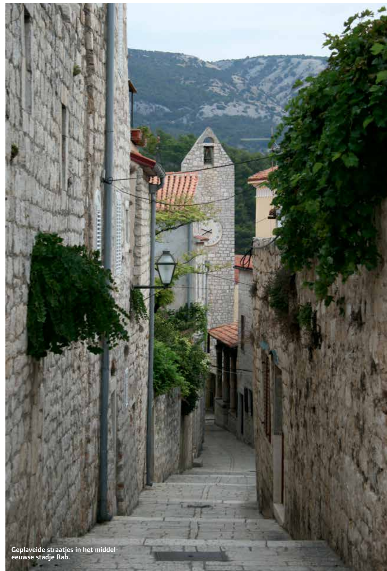
Geplaveide straatjes in het middeleeuwse stadje Rab.

Veli Losinj: restaurant Marina aan de haven. Gezellig buitenterras vlak aan het water, bekend voor visbereidingen en gerechten op houtvuur. Prima bediening, gezellige sfeer en uitstekende keuken.